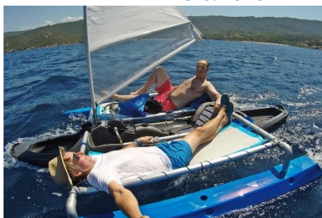
PEDAYAK TRIO & voile